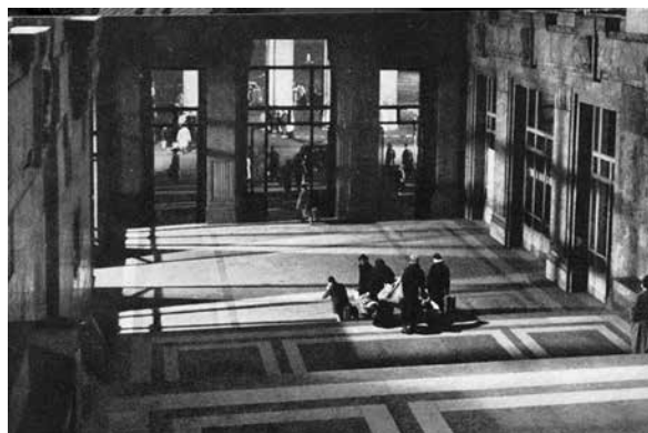
Figura 1. Fotograma de la película Rocco y sus hermanos

entonces. Madrid y Barcelona en España y Roma y Milán en Italia representaban la ilusión de mejorar condiciones de absoluta pobreza y falta de oportunidades que caracterizaban la vida en los pueblos rurales. Algunas obras literarias y sobre todo las del cine neorrealista de la época, tanto de Italia como de España, documentaron estos fenómenos de migración hacia las grandes ciudades 2 (Figuras 1 y 2).