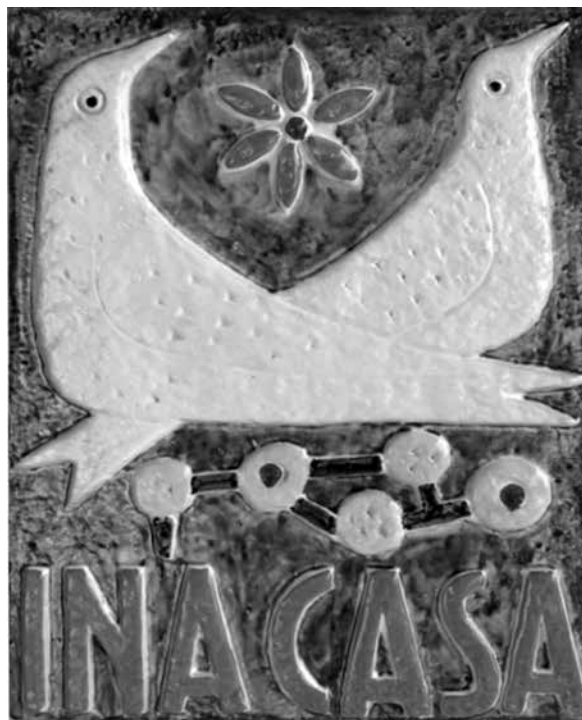
Figura 7. Italia: placa del INA, puesta en los nuevos desarrollos

La Ley 43, creada por el ministro del Trabajo Amintore Fanfani y aprobada en febrero de 1949 bajo el nombre de “Provvedimento per incrementare l’occupazione operaia. Case per lavoratori” 6 , era el programa para la construcción de vivienda más grande que Italia había conocido hasta entonces. Tomó el nombre de INA Casa (Figura 7) por el nombre la compañía nacional de seguros 7 que lo gestionaba (Di Biagi, 2001, p. 3).