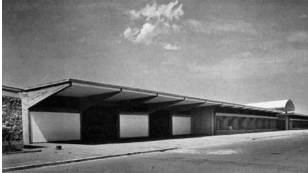
Figura 11. Italia: unità d'abitazione orizzontale nel quartiere Tuscolano a Roma