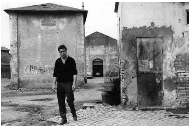
Figura 5. Borgata en Roma. Fotograma de la película Accattone