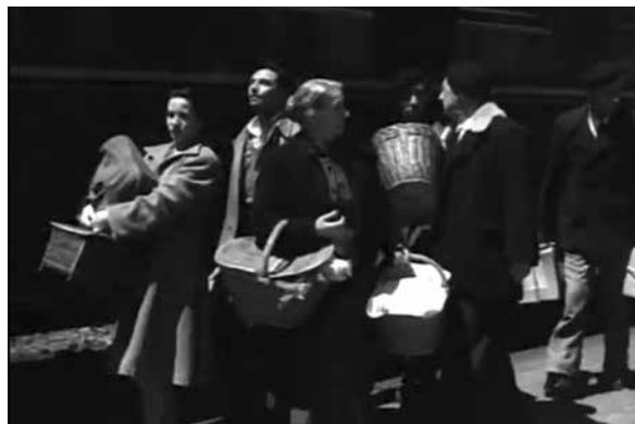
Figura 2. Fotograma de la película Surcos