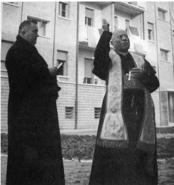
Figura 3. Italia: inauguración INA-Casa en 1952, en Ferrara

Otro tema que pone en paralelo las políticas económicas de los dos países es la consideración sobre la calidad y la cantidad de la fuerza de trabajo; la necesidad de buscar una fuerza trabajo no calificada para abaratar los costes de producción tenía como consecuencia que se hacían “de la vista gorda” a las invasiones de suelo y a la creación de barrios informales: