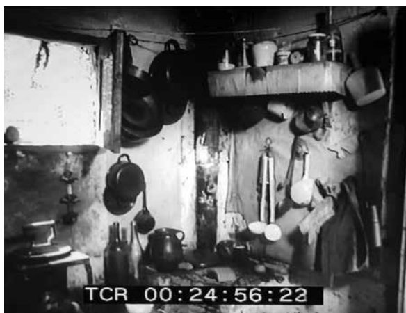
Figura 9. España: cocina en una chabola

Entre los aspectos positivos, cabe mencionar que las soluciones proyectuales planteadas en España e Italia establecieron unos estándares de calidad y marcaron una clara diferencia entre lo que hubiera tenido que ser una vivienda de protección en comparación con una del mercado libre y se formó una generación de profesionales que demostró el valor de la Arquitectura como disciplina social. Barrios como el Tiburtino, el Tusculano, la Unidad de Habitación Horizontal en Roma y los de Fuencarral, Entrevías, Caño Roto en Madrid son testimonios de una búsqueda de gran calidad de la vivienda que solo fue posible dentro de un sistema de gestión pública de las políticas habitacionales (Figuras 11 y 12).