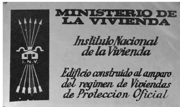
Figura 8. Placa del INV, puesta en los nuevos desarrollos