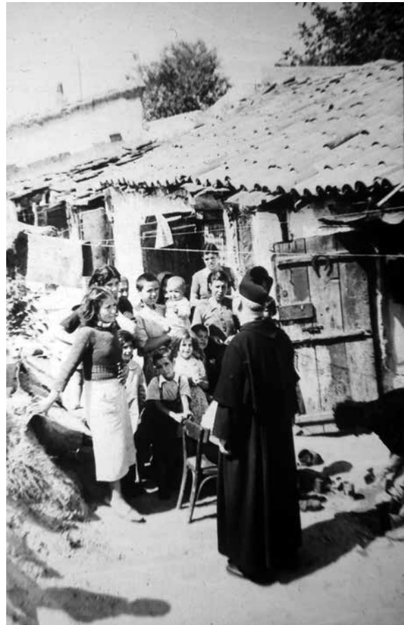
Figura 4. España: labor de apostolado en el barrio Entrevías en Madrid (1941)