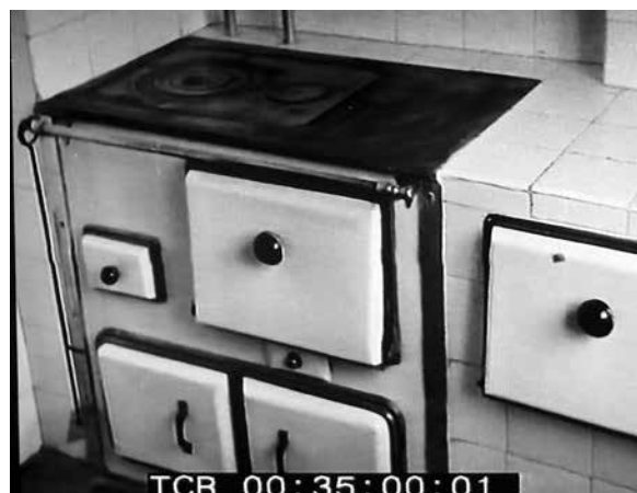
Figura 10. España: una nueva cocina en uno de los barrios INV