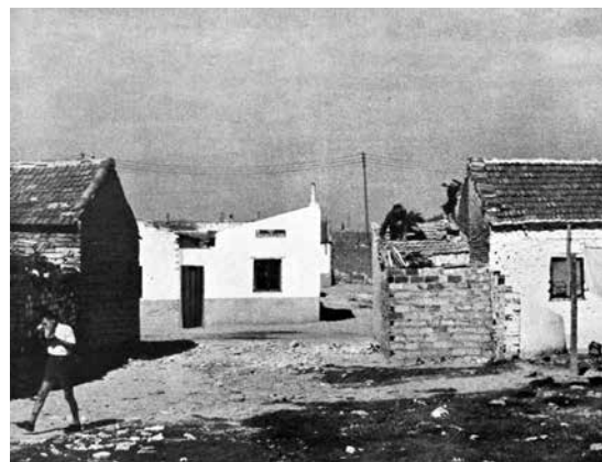
Figura 6. Barrio chabolista de El pozo, Madrid